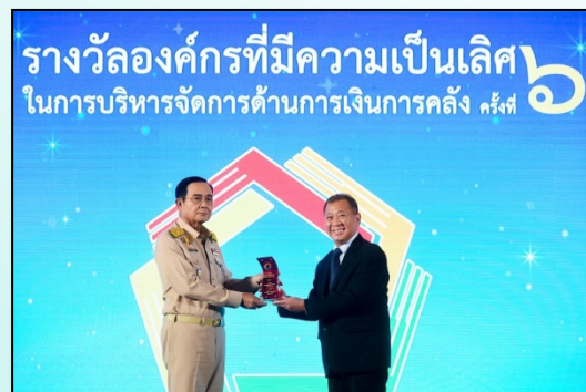
รางวัลองค์กรที่มีความเป็นเลิศ ในการบริหารจัดการด้านการเงินการคลัง ครั้งที่ 6 (รางวัลระดับดีด้านปลอด ความรับผิดชอบทางละเมิด)