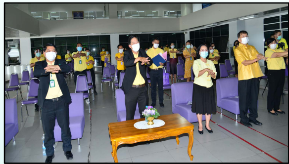
กิจกรรม “อนามัยสิ่งแวดล้อมปลอดภัย ห่างไกล (COVID-19)”